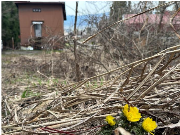
春先は水仙や福寿草が敷地内の各所に咲きます