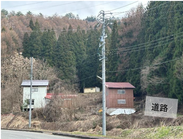
道路から見たようす