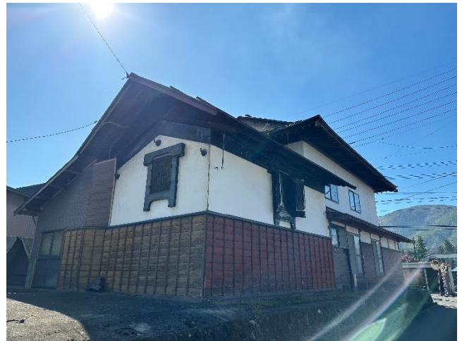
空き地部分 土蔵 居宅