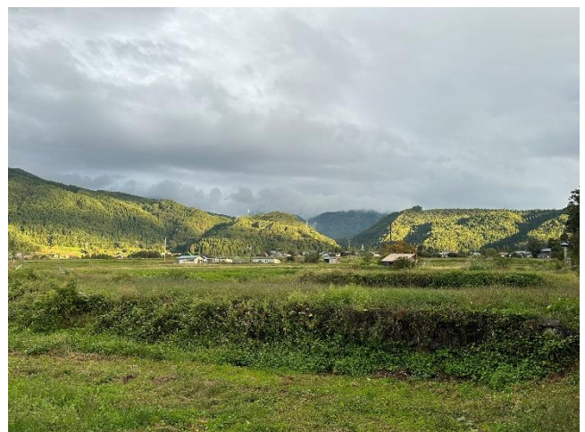
敷地裏からの眺望