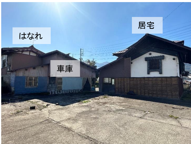
空き地部分(一部取り壊した跡地)