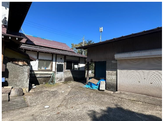
↙ 玄関 ↑ 土蔵部分 ↑ 車庫