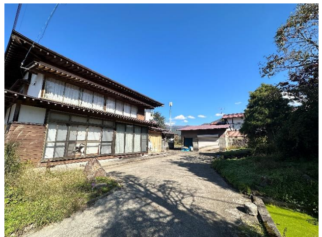
敷地入口からみたようす