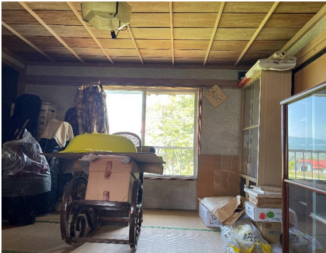
物置(2階和室・北側)