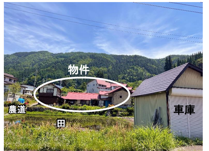
みちした 道下から