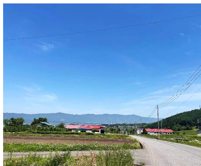
物件の道下から飯山市方面の景色