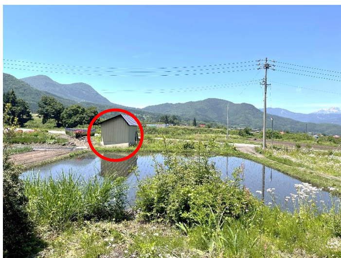
物件正面からの景色(田んぼと車庫)