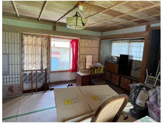
物置(2階和室・南側)