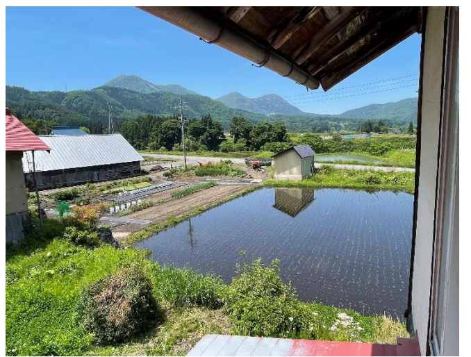
物置2階からの眺望