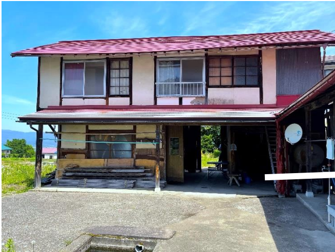
前庭から見た物置