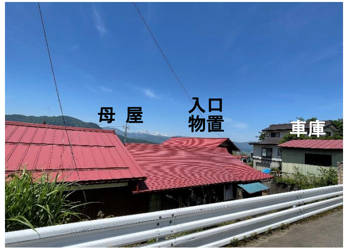
物件の道上から みちうえ