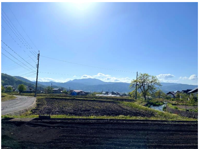
物件土地から西側の眺望