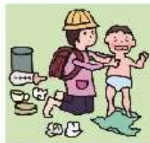
家族に代わり、幼いきょうだいの世話をしている