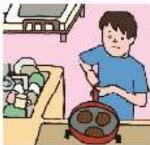
障がいや病気のある家族に代わり、買い物・料理・掃除・洗濯などの家事をしている

家族にケアを要する人がいる場合に、大人が担うようなケア責任を引き受け、家事や家族の世話、介護、感情面のサポートなどを行っている18歳未満の子どもをいいます。