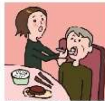
障がいや病気のある家族の身の回りの世話をしている