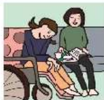
障がいや病気のあるきょうだいの世帯や見守りをしている