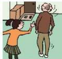
目を離せない家族の見守りや声かけなどの気づかいをしている