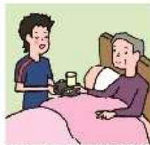
がん・難病・精神疾患など慢性的な療気の家族の看病をしている