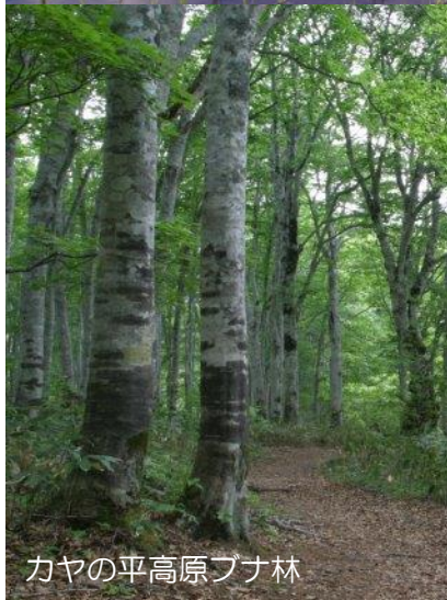
カヤの平高原ブナ林