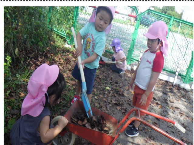
葉っぱ集めに夢中です。何に使うのかな？