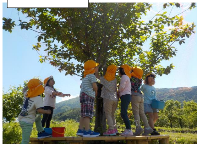
今年は鳥に食べられない様にネットをかけました。おかげで沢山のサクラランボが実りました。