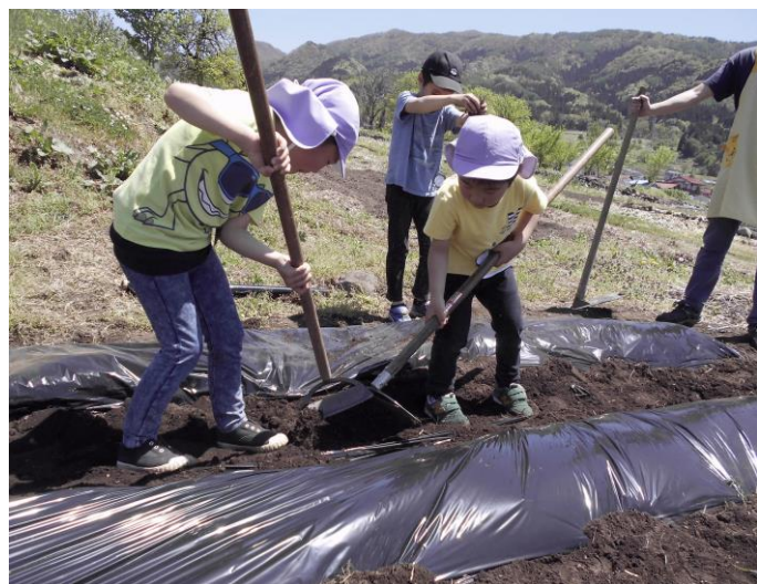
みどり組の子どもたちが畑にマルチをかけました。上手ですね。何を植えるか楽しみです。