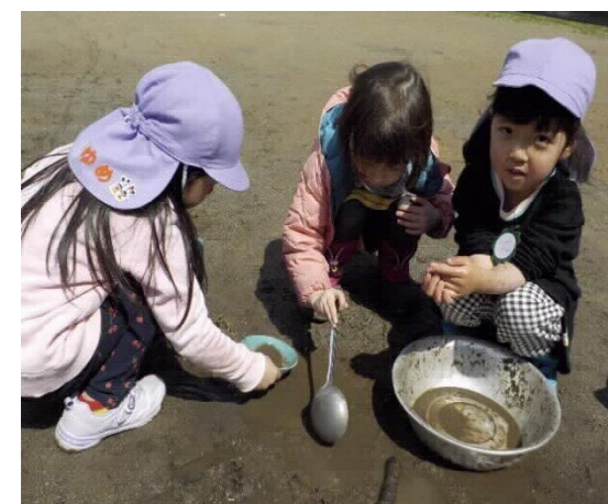
みどり組になっての、ご馳走作りです。だれに食べてもらうのかな?