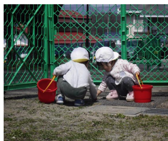
しろ組の子どもたちが砂場で何かを見つけました。あかいバケツの中が楽しみですね