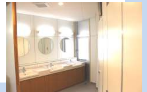
シャワー (洗面) ルーム