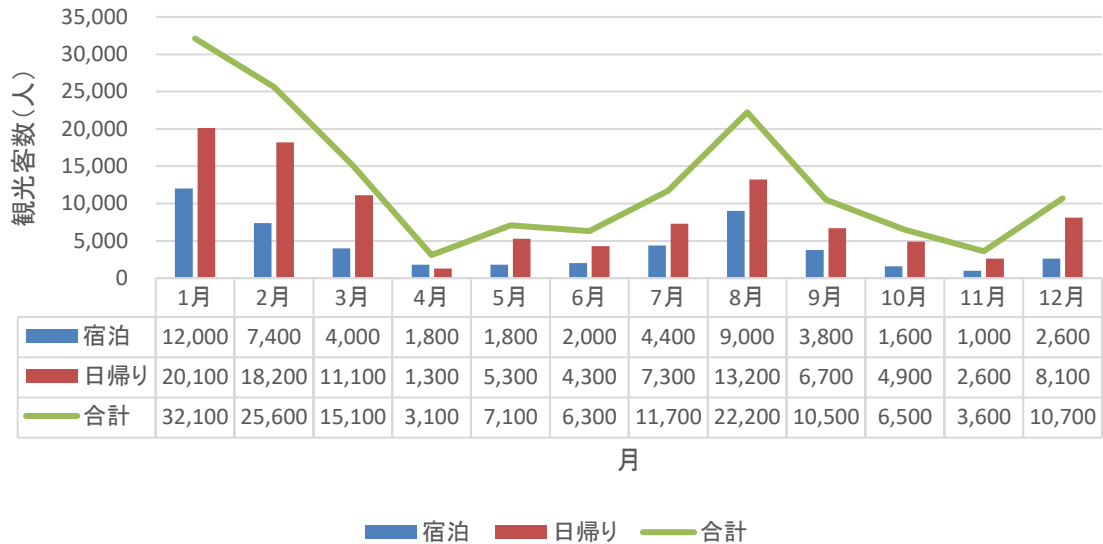
グラフ3 月ごとの木島平村における観光地利用者延数 (R6年データ)