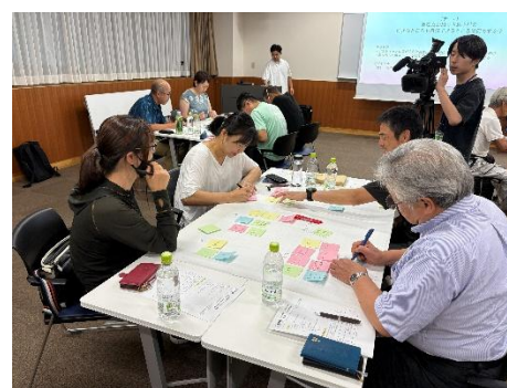
木島平村村民会議の様子