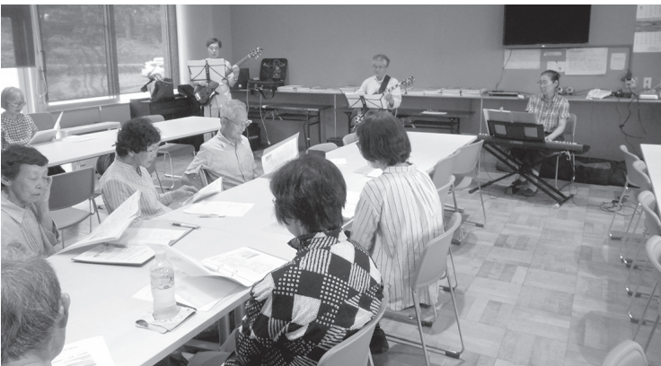
サークル活動：合唱

後半のサークル活動は合唱、今年も「木島平を音楽で盛り上げ隊」の皆様が指導をいただき、夏の歌「夏は来ぬ」「夏の思い出」、また、今年は村制施行70周年となることから村歌「栄え行け木島平よ」など全10曲を皆で歌いました。