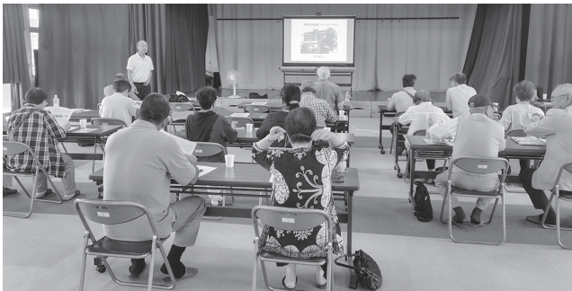
小諸市人権センターで講義を受ける

5月中に行った事前学習会に出席された人権センター事業ふれあい趣味の講座受講生の他総勢19人の参加により、長野県内東信地区の部落差別の歴史と現状について、小諸市人権センターでの講義と周辺地域のフィールドワークを通して学びました。