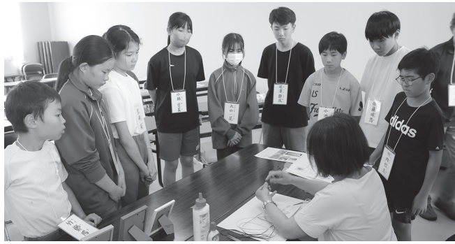
最初に通り作り方を教わる

小中学生全員が会員の雪ん子人権子ども会、その活動を推進する小中学生を代表する10名の委員による雪ん子委員会が、6月18日に第2回、7月9日に第3回が開催されました。第2回・第3回の雪ん子委員会では、昨年までは絵手紙を制作していましたが、今年は新たに、クラフト手芸であるペーパークイリングの花額の制作に挑戦しました。