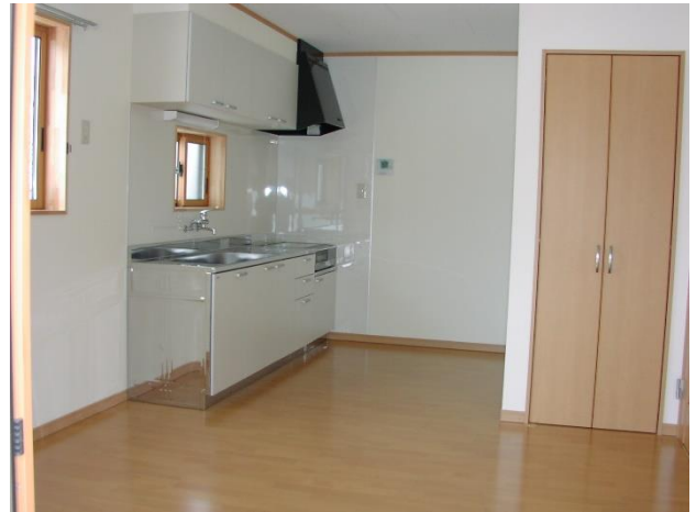
1階リビングダイニングキッチン