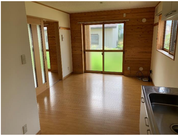
1階リビングダイニングキッチン