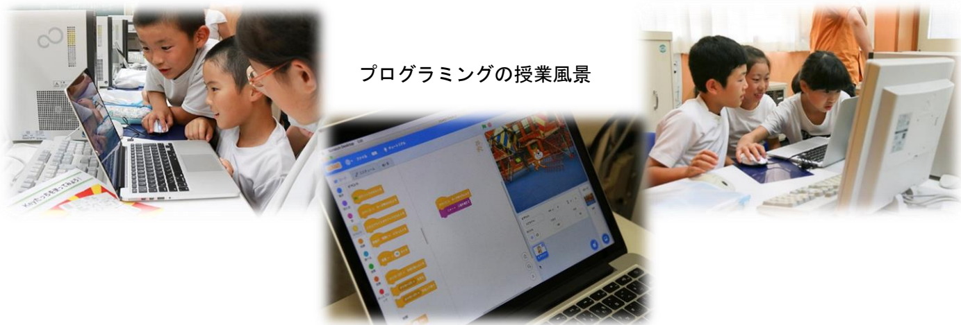
プログラミングの授業風景

令和2年度からのプログラミング教育必修化に先立ち、令和元年度から先行してプログラミングの授業を実施しています。