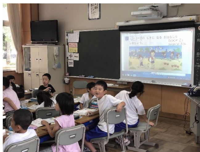
電子黒板による授業風景

令和2年の新・学習指導要領実施に向け、平成30年度に小中学校ICT環境整備事業として、木島平小学校の図工室を除く全教室、木島平中学校の全教室に電子黒板を、小学校に60台、中学校に30台のタブレット端末を整備しました。