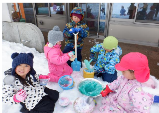
雪に、絵の具で色をつけておままごとです。おいしいご馳走が出来上がりました。おままごと、とっても楽しい♪また明日もやりたいね。