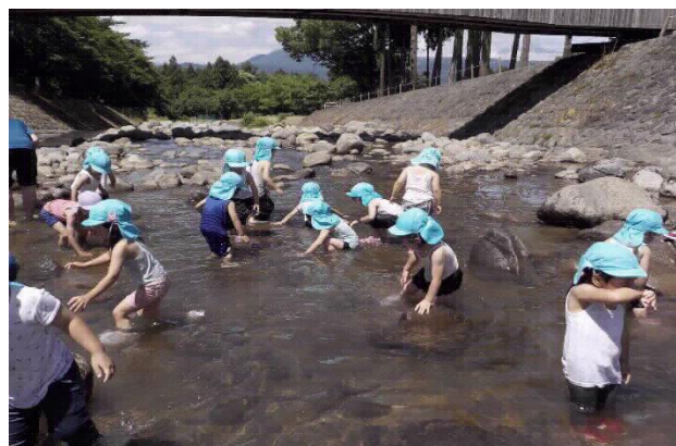
きいろ組の子ども達がケヤキの森へ川遊びに行きました。プール開きが楽しみですね。

◎お願い ☆家から虫かごを持ってくるお友達がいますが、トラブルの原因になりますので、保育園には持ってこないよう、お願いします。