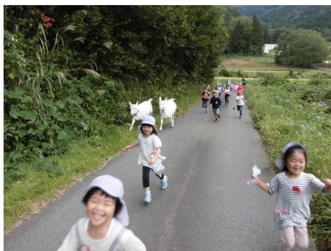
あか組さんがお散歩に行き、やぎとかけっこよーいどん、誰が早いかな?がんばれーがんばれー