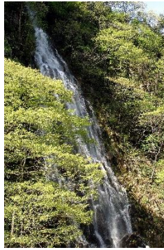
年に2回しか姿を現さない ”幻の滝「樽滝」”(糠千)