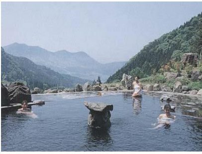
東日本雪景色の美しい温泉No.1 馬曲温泉 望郷の湯(馬曲)