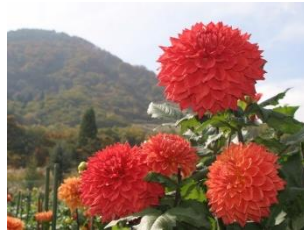
約260種2万本のダリア は見頃！ (やまびこの丘公園)