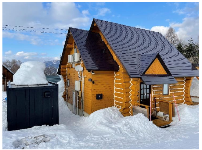
ウィンターシーズン(3月)