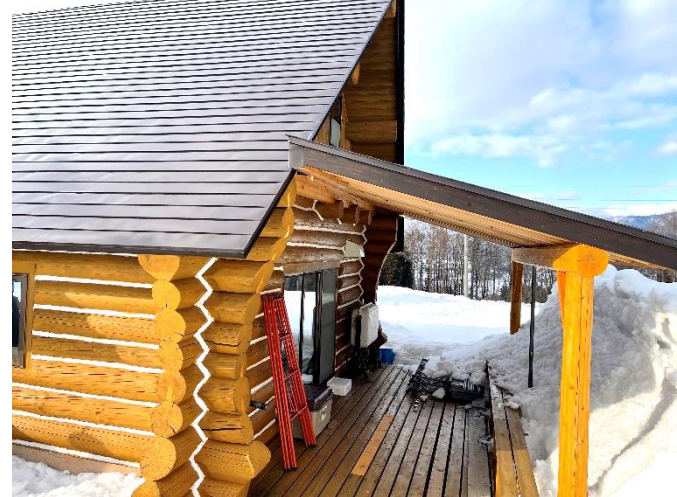
ウッドデッキの様子