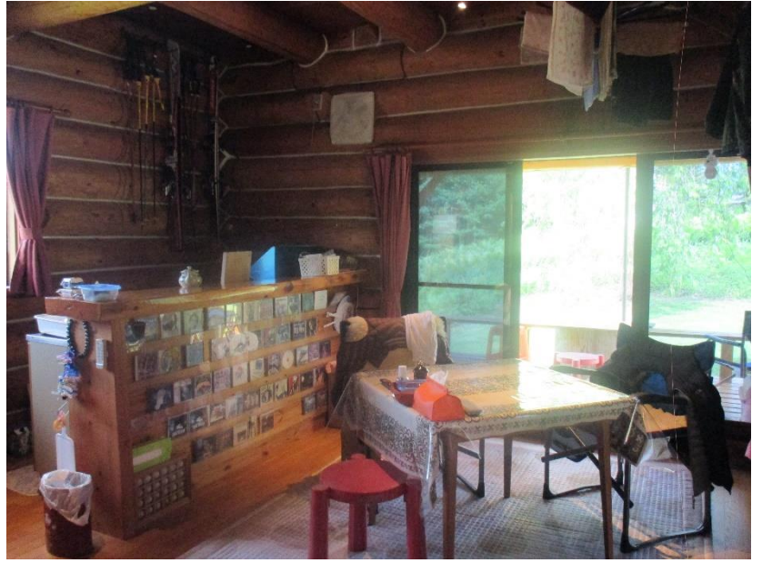
キッチンカウンター