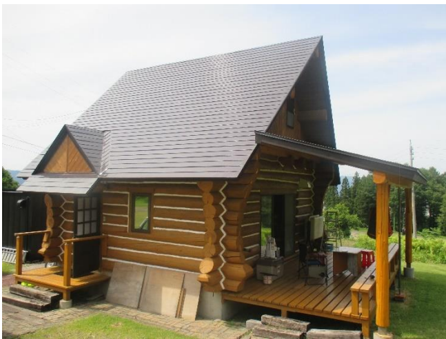
グリーンシーズン(6月)