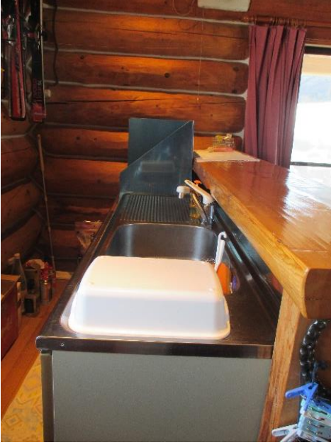
キッチンカウンター